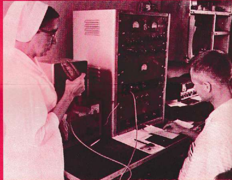
Grâce à la radio, les malades peuvent être secourus rapidement.

Acceptez avec bienveillance de participer à cette grande entreprise — Avion pour le peuple, par le peuple — en souscrivant généreusement aux "AILES de l'ESPERANCE"... aujourd'hui!